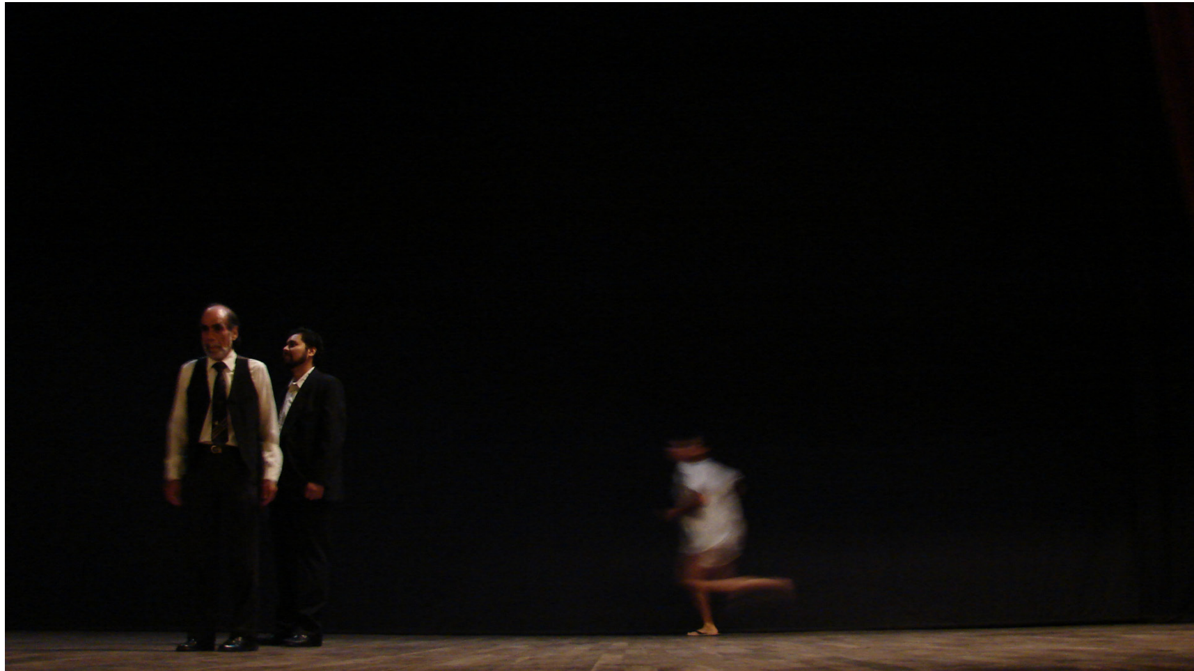
Fotografía para la puesta en escena “Reencuentro”, de Alfonso Pérez de Alba (Ariel a la mejor Ópera prima 1988)